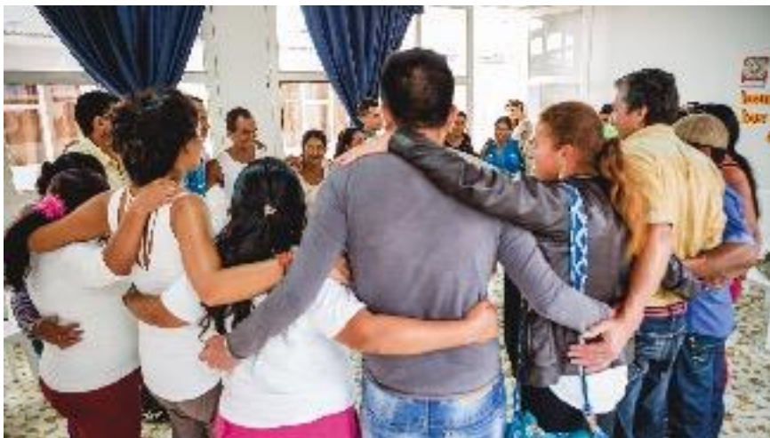
Participantes del taller en Samaniego, Nariño. Actividad de cierre en el que tiene lugar un abrazo colectivo. Octubre de 2015.