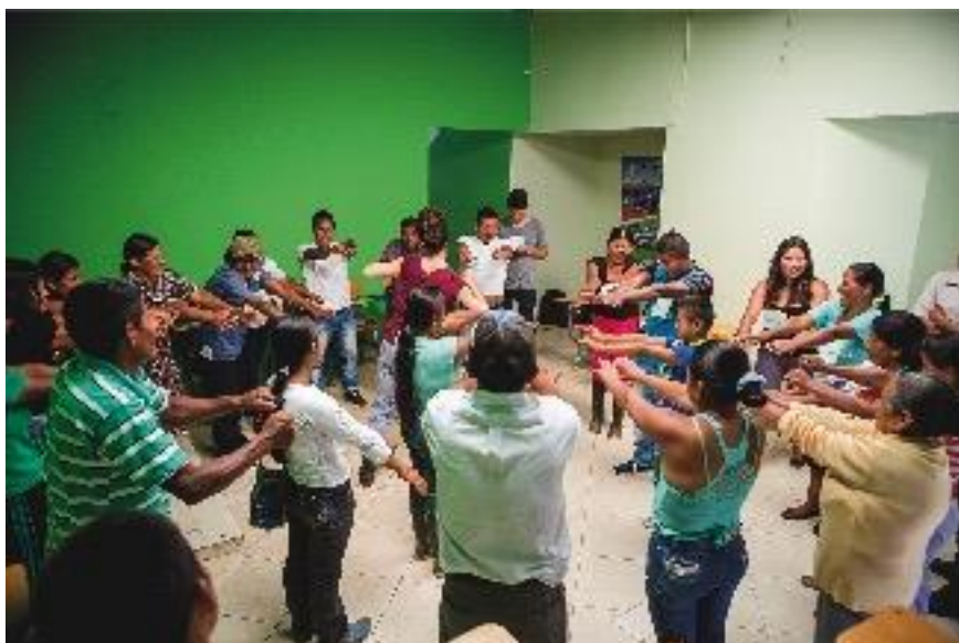
Participantes del taller en Ricaurte, Nariño. Actividad para estirar y movilizar partes del cuerpo. Agosto de 2015.

En la apuesta por trabajar con dinámicas participativas que tienen presente la memoria corporal, resulta esencial el factor del tiempo, esto es, la duración de los talleres y el alcance de los mismos. Es importante dejar claro que el proceso de reconstrucción de memoria puede, pero no necesariamente, conducir a generar procesos de cambio o elaboración de las memorias en los participantes.