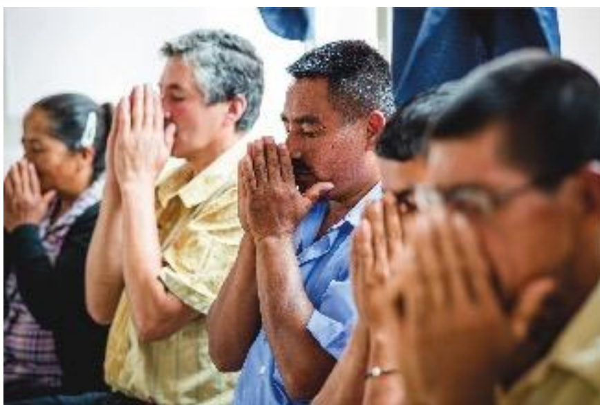
Participantes del taller en Samaniego, Nariño. Ejercicio para activar la respiración por medio de una esencia herbal. Octubre de 2015.

Expresamos también un sincero agradecimiento a las organizaciones que nos ayudaron con las convocatorias de las personas participantes, nos acompañaron en las actividades y posibilitaron que los talleres se llevaran a cabo. En particular, expresamos nuestro reconocimiento a DAICMA (Dirección de Acción Integral contra Minas Antipersonal), Campaña Colombiana Contra Minas, Fundación Tierra de Paz, Pastoral Social (SEPASVI en Nariño), Cruz Roja Colombiana y las asociaciones de víctimas de MAP y REG de Samaniego (Nariño), Arauca, Cúcuta (Norte de Santander) y Antioquia por su generosidad y los esfuerzos para reunir a las personas convidadas y receptividad ante la petición de los lugares acogedores y cómodos para desarrollar los talleres.