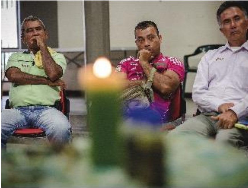
Hombres participantes del taller en Puerto Asís, Putumayo. Actividad de diálogo grupal. Septiembre de 2015.

Un ejemplo para comprender esto último fue recordar (o aludir) a la respiración como un mecanismo que nos acompaña toda la vida -el aire que entra y el aire que sale-; mientras estemos respirando el cuerpo seguirá su proceso de regeneración celular, es decir, de cambio y de impulso.