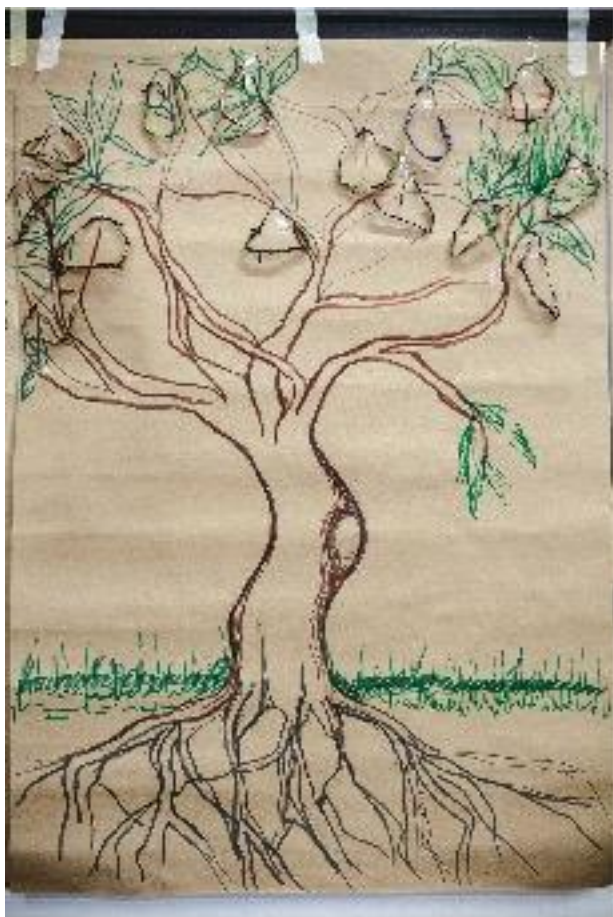
Dibujo realizado por el equipo para el taller en Cocorná, Antioquia. Julio de 2015.