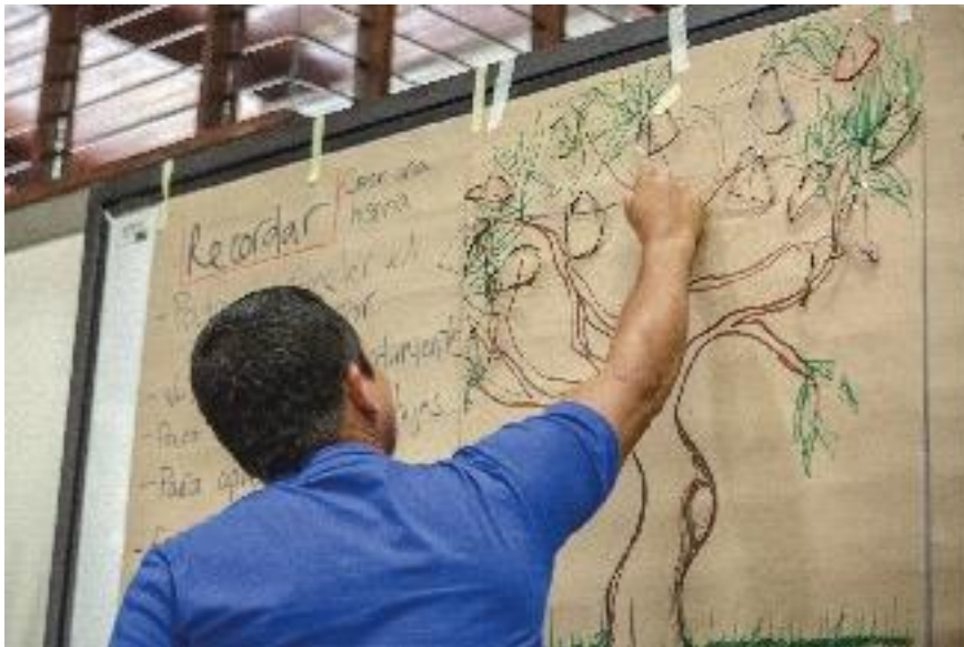
Hombre participante del taller en Puerto Asís, Putumayo. Actividad en donde el participante elige una manilla para regalársela a otra persona participante. Septiembre de 2016.

el territorio. Importante que también se promuevan narraciones y representaciones que vayan más allá de los hechos victimizantes, como por ejemplo, las pruebas de la comida propia de la región, actividades culturales o de entretenimiento como irse a bañar al río o también animales con los que se pueda encontrar en el recorrido por el territorio.