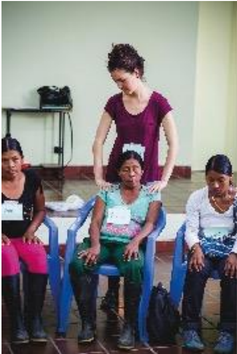
Participantes del taller en Ricaurte, Nariño. Agosto de 2015. Actividad de respiración en donde quien facilita pone sus manos en los hombros de una participante.