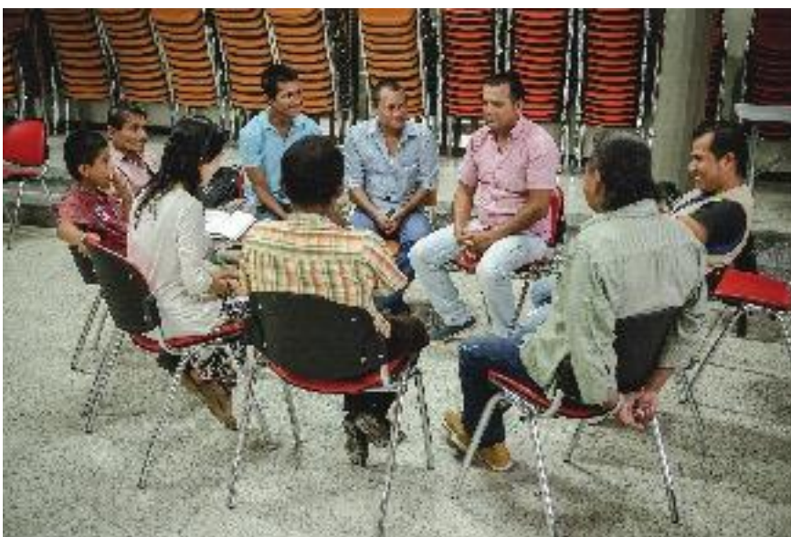
Participantes del taller en Puerto Asís, Putumayo. Grupo en donde cada quien habla de los momentos importantes de su biografía. Septiembre de 2015.

Se recomienda empezar preguntándoles por las memorias de infancia o adolescencia y se busca rescatar los rasgos particulares de cada historia, pero también los aspectos que se comparten y se entrecruzan, como las ramas del árbol. Adicionalmente se les pregunta acerca de sus saberes y actos de resistencia, sobre las posibles acciones organizativas y estrategias que han usado para salir adelante.