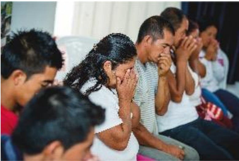
Participantes del taller en Samaniego, Nariño, oliendo la esencia herbal y conectándose con la respiración. Octubre de 2015.

que hagan lo que necesiten para estar más a gusto, cómodos y tranquilos; esto es, por ejemplo, algún movimiento o un cambio de puesto. Se enfatiza en los estímulos sensoriales. Después del tiempo que se considere pertinente y según el estado de las personas presentes, se invita a que abran los ojos lentamente; primero pueden ponerse las manos en los ojos, hacer un pequeño masaje y luego sí abrirlos poco a poco. Se muestra la esencia herbal y se les explica a quienes están allí de dónde viene, el proceso de elaboración, las plantas que contiene y se presenta como símbolo de los talleres. Quienes facilitan la actividad reparten a cada participante una o varias gotas de la esencia en la palma de la mano y explican cómo usarla: se frota las manos y se huele profundamente tres veces. En el caso de los talleres del informe, algunas personas con amputación de miembro superior u otro tipo de discapacidad fueron asistidas por alguien del equipo facilitador, otros optaron por hacerlo solos. Es importante recalcar que la esencia es símbolo de cuidado, escucha, tranquilidad y amor, y se invita a que cada uno se conecte con un lugar seguro en sí mismo.