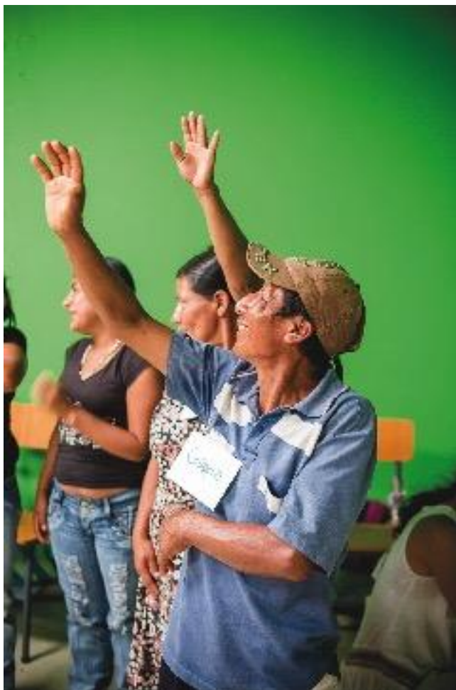
Participantes del taller en Ricaurte, Nariño. Actividad para estirar y movilizar partes del cuerpo. Agosto de 2015.