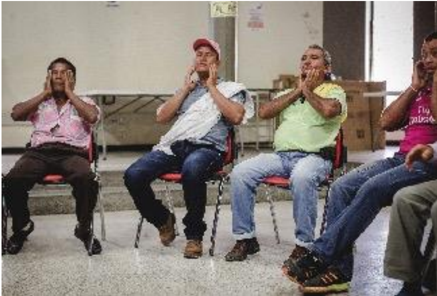
Participantes del taller en Puerto Asís, Putumayo. Actividad donde cada persona participante realiza un automasaje para despertar y distensionar los músculos. Septiembre de 2015.