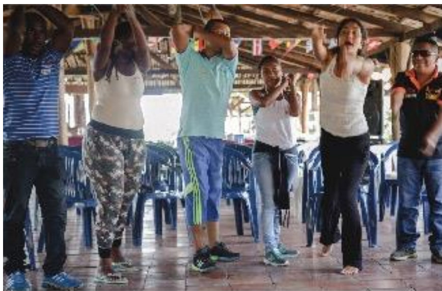
Taller en Santander de Quilichao, Cauca. Actividad donde las personas participantes representan acciones que se hacen en el campo, en este caso, pescar. Septiembre de 2015.

Partimos de una concepción del ser integral entendiendo que el cambio en una parte afecta el todo. Reconocemos la interacción entre las diferentes dimensiones que nos componen, dimensión emocional, física, mental y espiritual, y tenemos presente que los ejercicios prácticos que se realizan tienen el potencial de afectar diferentes áreas de la vida de la persona. En efecto, hablamos de corporalidad para referirnos a las diferentes dimensiones del ser y su integración pero además para reconocer las relaciones con otros y el entorno: “La corporalidad es el conocimiento inmediato de nuestro cuerpo, sea en estado de reposo o en movimiento, en función de la interrelación de sus partes y de su relación en el espacio y los objetos que nos rodean” (Le Boulch, 1997, página 3).