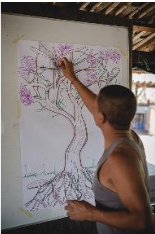
Participante del taller en Santander de Quilichao, Cauca. El participante está tomando una de las manillas que se entregan como cierre simbólico en el segundo día de taller (ver explicación más adelante). Septiembre de 2015.

En el tercer nivel se mencionan las ramas, las hojas, los frutos y el espacio para hablar de las relaciones con el territorio. Los frutos que damos tienen que ver con la manera como nos hemos nutrido y asimismo, el árbol nunca está solo, está en un bosque o en un territorio en constante relación con su entorno. Indagamos en las relaciones comunitarias, los daños colectivos, el territorio, las acciones organizativas, de paz y de resistencia. En este nivel es importante poder enunciar e identificar las formas particulares como el territorio se ve afectado.