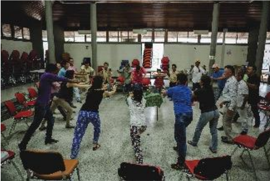
Participantes del taller en Puerto Asís, Putumayo. Actividad donde las personas participantes representan acciones que se hacen en el campo. Septiembre de 2015.

Una segunda ronda puede hacerse con una música movida y divertida. En la misma dinámica grupal, se invita a que den ideas y representen movimientos y acciones que se hacen en el campo (o relacionados con los oficios típicos de la región), por ejemplo: cortar leña, arar la tierra, palear, pescar, cazar, cocinar, etc.