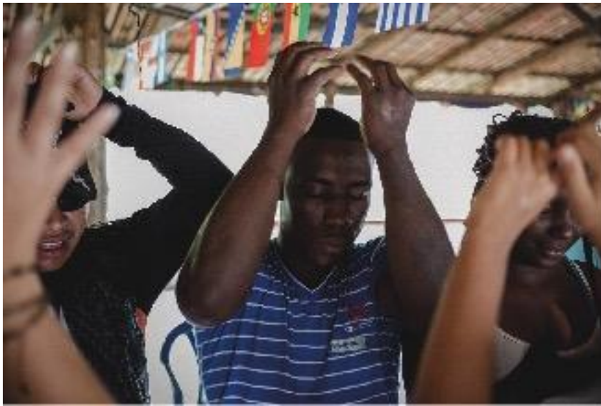
Participantes del taller en Santander de Quilichao, Cauca. Actividad de respiración y visualización del árbol. Septiembre de 2015.