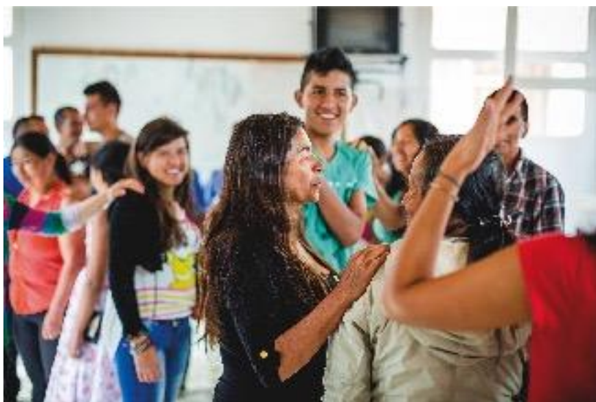
Participantes del taller en Samaniego, Nariño, desplazándose por el espacio en diferentes ritmos. Octubre de 2015.

¿Para qué recordar?, ¿para qué olvidar?, ¿por qué cree usted que es importante hacer memoria?