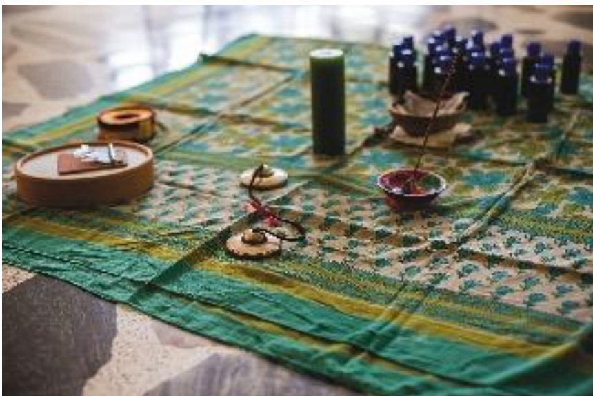
Taller en Cocorná, Antioquia. Julio de 2015. Alistamiento del espacio: tela con vela encendida, esencias herbales, instrumentos y objetos de valor simbólico que se consideren propicios.

Se recibe a quienes van a participar con música mientras van llegando y se les ayuda a ubicarse en un lugar. Los detalles son importantes: por ejemplo, quitar elementos innecesarios y que distraen.