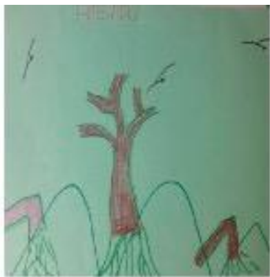
Dibujos realizados por mujer del taller en Cocorná, Antioquia. Julio de 2015.

La invitación al movimiento es una manera de integrar a las personas participantes y posibilitarles que se conecten consigo mismas y con los demás. Los espacios en que todas las personas pueden moverse de acuerdo a su sentir y voluntad representan una oportunidad para participar, estar presente y comunicar. Para quienes no hablan mucho o les cuesta expresarse verbalmente, los espacios de movimiento son inclusivos y en varios casos divertidos. En efecto, consideramos que fue un gran acierto metodológico introducir elementos lúdicos y hasta con un pequeño reto de movilidad. Por ejemplo, se les invitó a hacer una coreografía corta que se fue construyendo con movimientos creados por ellos. Este elemento ayudó a que los cuerpos se soltaran, relajaran y además fue una manera diferente de compartir en colectividad.