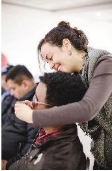
Hombre participante del taller para policías en Bogotá. En algunos talleres las facilitadoras ayudan a personas participantes a oler la esencia cuando hay alguna discapacidad con sus miembros superiores que no se lo permita. Abril de 2016.